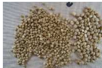
Figura 4: Aumento del tamaño del grano de Quínoa.

resultante de la hibridación de los Ecotipos BO 150 y BO15