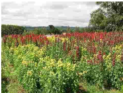
Figura 5: Ensayos de rendimiento de Quínoa, realizados en la Región de la Araucanía.