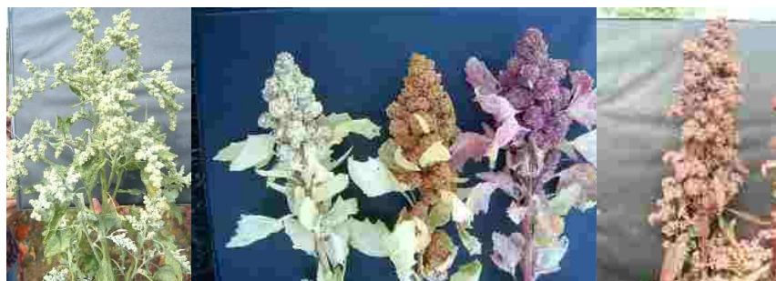
Figura 1: Ejemplos de la diversidad genética, en este caso presente en las diferentes panojas de Quínoa, colectadas y conservadas en el Banco de Germoplasma de Agrogen.