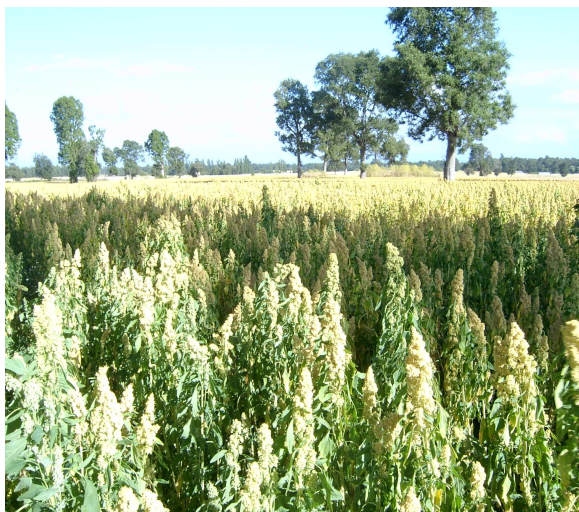
Figura 9: Siembra comercial de Regalona-B, en la Región de la Araucanía.