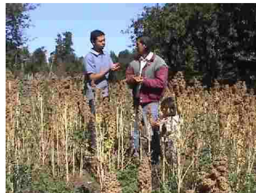
Figura 6: Cosecha de Quínoa, realizada con las municipalidades de la precordillera y Semillas Baer.